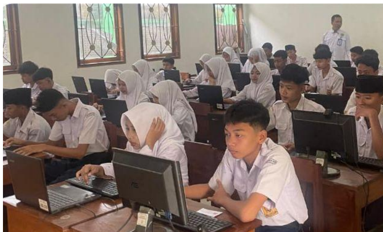
Gambar 2. Implementasi kurikulum berbasis cinta

Integrasi KBC dengan Kurikulum Merdeka tampak dalam penyusunan perangkat ajar seperti modul ajar dan RPP yang memasukkan komponen penguatan karakter KBC. Selain itu, kegiatan proyek dalam Profil Pelajar Pancasila dan Profil Pelajar Rahmatan lil 'Alamin dipadukan dengan aktivitas keagamaan, empati, dan sikap saling menghargai. Guru menerapkan pembelajaran berdiferensiasi sesuai prinsip Kurikulum Merdeka, namun tetap membawa nuansa kasih sayang dalam pendekatan instruksional. Implementasi kurikulum terlihat berjalan pada dua ranah: struktur Kurikulum Merdeka dan budaya KBC. Dalam bidang kesiswaan, KBC mempengaruhi seluruh pembiasaan harian. Koordinator Kesiswaan menjelaskan bahwa program pembinaan akhlak, penguatan kedisiplinan, kegiatan ibadah, dan pendampingan perilaku siswa seluruhnya mengacu pada nilai cinta dan empati. Pendekatan ini menjadi strategi dalam mengubah perilaku siswa dari pasif menjadi lebih aktif, kreatif, dan kooperatif. Di bidang SDM dan humas, fakta menunjukkan bahwa guru diberi pelatihan internal untuk memahami implementasi KBC. Keteladanan guru dipandang sebagai instrumen utama penanaman karakter KBC. Selain itu, humas melakukan sosialisasi kepada orang tua agar mereka memahami filosofi pendidikan berbasis cinta yang diterapkan madrasah.