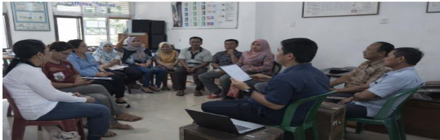
Gambar 2. Aktivitas Pembelajaran Bahasa Inggris Berbasis Praktik

Keseluruhan, ketiga komponen modal sosial tersebut saling berinteraksi dan membentuk sistem sosial yang mendukung pembelajaran Bahasa Inggris sebagai bagian dari pengembangan ekonomi desa wisata. Temuan ini menegaskan bahwa keberhasilan pembelajaran berbasis komunitas tidak hanya ditentukan oleh aspek teknis atau metode pembelajaran, tetapi juga oleh kekuatan hubungan sosial yang ada dalam masyarakat. Dengan demikian, modal sosial dapat diposisikan sebagai sumber daya strategis dalam meningkatkan efektivitas program pembelajaran sekaligus memperkuat keberlanjutan ekonomi lokal ( Su et al., 2021 ).