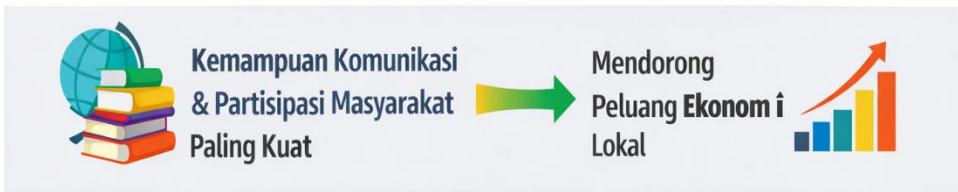
Gambar 1. Peningkatan Dampak