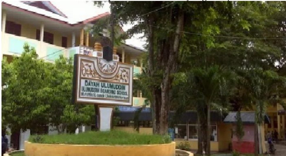
Gambar 2. Konteks lokasi penelitian pada sekolah Islam berbasis pesantren modern

Untuk memberikan konteks empiris penelitian, berikut disajikan gambaran umum lokasi penelitian pada sekolah Islam berbasis pesantren modern yang menjadi locus studi kasus ini.