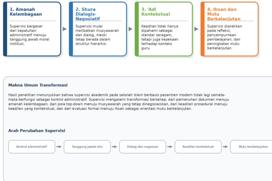
Gambar 3. Transformasi Supervisi Berbasis Nilai Manajemen Islam

Untuk memperjelas hubungan antartema dan arah transformasi supervisi secara lebih visual, ringkasan temuan penelitian disajikan pada Gambar 3.