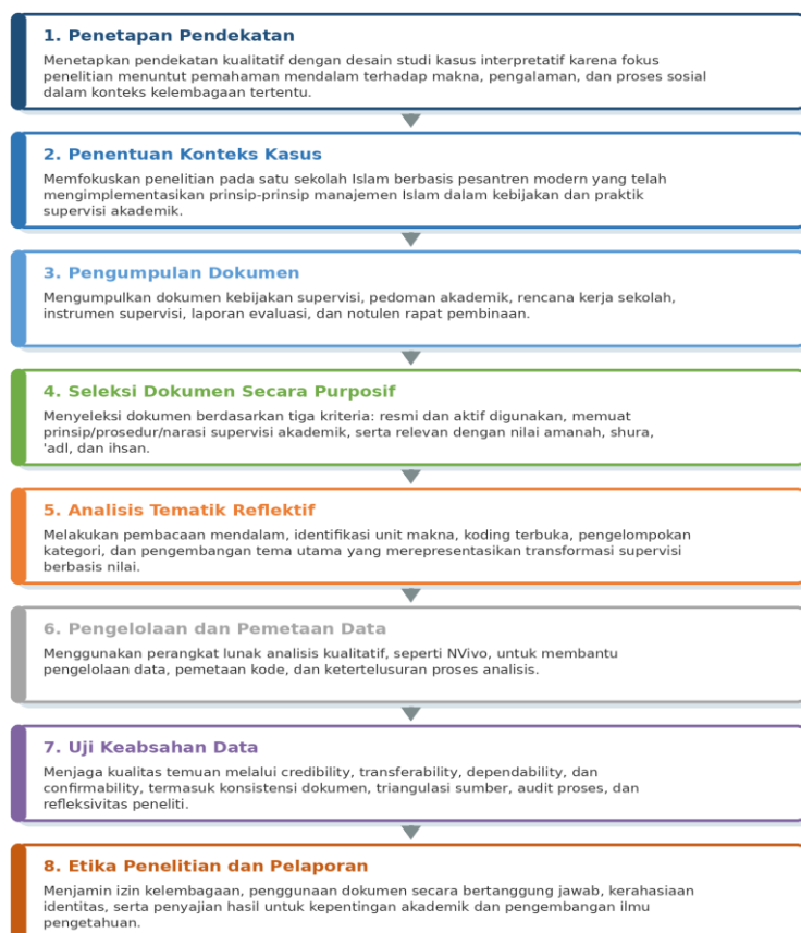
Gambar 1. Langkah-langkah Metode Penelitian

modern yang telah mengimplementasikan prinsip-prinsip manajemen Islam dalam kebijakan dan praktik supervisi akademik. Data utama diperoleh melalui analisis dokumen, meliputi dokumen kebijakan supervisi, pedoman akademik, rencana kerja sekolah, instrumen supervisi, laporan evaluasi, serta notulen rapat pembinaan. Strategi pemilihan dokumen dilakukan secara purposif dengan kriteria inklusi: (1) dokumen resmi dan digunakan aktif dalam praktik supervisi, (2) memuat prinsip, prosedur, atau narasi supervisi akademik, dan (3) relevan dengan nilai-nilai manajemen Islam seperti amanah, shura, 'adl, dan ihsan. Jumlah dokumen dianalisis secara bertahap hingga mencapai saturasi makna, yakni ketika tidak ditemukan tema substantif baru yang relevan dengan fokus penelitian. Secara ringkas, tahapan penelitian ini dapat digambarkan pada Gambar 1.