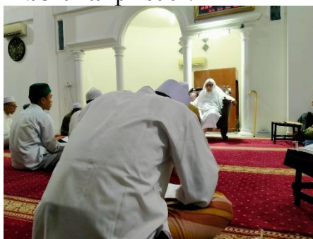
Gambar 1. Proses komunikasi antarpribadi

dapat diakses secara optimal oleh seluruh santri. Sebagaimana foto berikut yang menggambarkan situasi komunikasi antarpribadi: