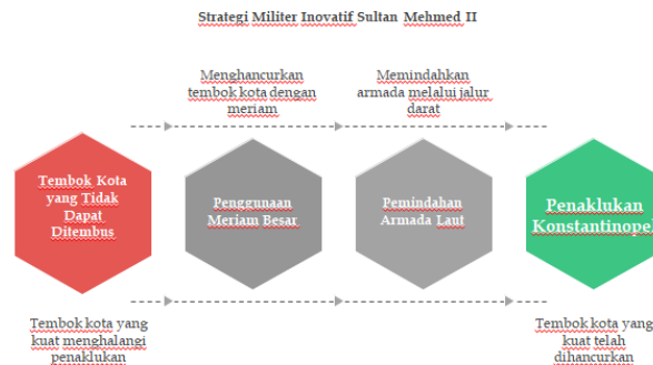
Gambar 2. Strategi Militer Inovatif Sultan Mehmed II

Dalam aspek militer, Sultan Mehmed II menerapkan berbagai strategi inovatif yang melampaui zamannya. Salah satu strategi paling revolusioner adalah penggunaan meriam besar untuk menghancurkan tembok kota, yang menjadi simbol kemajuan teknologi militer pada masa itu. Selain itu, ia juga memindahkan armada laut melalui jalur darat untuk menghindari blokade di Selat Golden Horn, sebuah langkah taktis yang menunjukkan kecerdasan strategis luar biasa (Ramadoni, 2022).