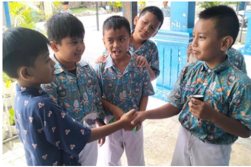
Gambar 7. Pembiasaan sikap siswa terhadap sesama

Jika implementasi berjalan efektif, para pelaksana tidak hanya harus mengetahui apa yang harus dilakukan dan memiliki kemampuan untuk melakukannya, tetapi mereka juga harus memiliki keinginan untuk melaksanakan suatu kebijakan (Edwards, 1980). Di SD Hang Tuah 7 Surabaya, disposisi atau sikap pelaksana menunjukkan bahwa komitmen kepala sekolah, guru, tendik, hingga siswa sangat tinggi pada implementasi program SAS dalam upaya menciptakan budaya sekolah yang aman dan positif dengan adanya pencegahan tindakan bullying .