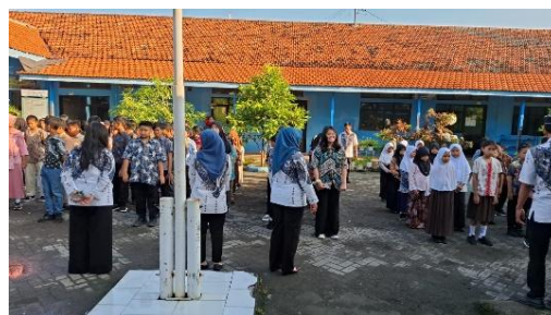
Gambar 6. Sosialisasi anti bullying ketika PPK Pagi

Informasi mengenai kebijakan dan peraturan program SAS harus jelas dan mudah dipahami oleh setiap warga sekolah untuk mencapai efektifitas implementasi program. Dalam hal ini kepala sekolah dan seluruh tenaga pendidik memiliki peran penting untuk mengarahkan bagaimana kegiatan dilaksanakan sesuai dengan peraturan yang tercantum. Kepala sekolah sudah cukup jelas memberikan informasi dan arahan mengenai peran dan tanggungjawab seorang guru dengan jelas pada setiap rapat. Begitupun dengan guru juga harus meneruskan informasi dan arahan ke siswa dengan jelas agar mudah dipahami, dengan cara disetiap pembelajaran disisipkan materi yang mengarah pada pendidikan karakter anti bullying untuk memberi contoh secara nyata agar mudah dipahami. Bahkan ketika diluar kelas siswa juga selalu mendapatkan sosialisasi anti bullying pada saat upacara.