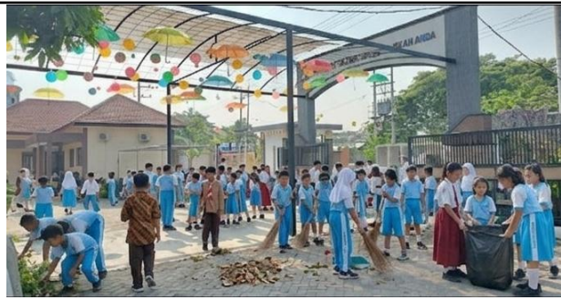
Gambar 4. Kegiatan Gotong Royong

Dengan demikian, keempat komponen implementasi Program SAS di SD Hang Tuah 7 Surabaya telah mendukung menciptakan budaya sekolah yang positif. Budaya sekolah yang aman, menyenangkan, edukatif, dan penuh kebersamaan sangat penting untuk menumbuhkan perilaku sosial yang baik pada siswa dan dapat meminimalisir tindakan bullying . Hasil penelitian ini sejalan dengan temuan yang dikemukakan oleh (Sari, 2025) bahwa sekolah memiliki peran untuk membangun budaya dan lingkungan sekolah melalui pembiasaan positif untuk memperkuat kesadaran siswa terhadap bullying . penelitian ini juga sejalan dengan penelitian (Rawlings & Stoddard, 2019) yang menjelaskan bahwa program pencegahan bullying yang efektif perlu dilaksanakan secara komprehensif dengan melibatkan seluruh warga sekolah, yang fokus tidak hanya pada penanganan pelaku dan korban tapi juga menciptakan lingkungan sekolah yang aman, nyaman, dan dukunagn dari seluruh warga sekolah.