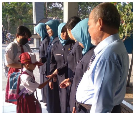
Gambar 2. Kegiatan Pembiasaan 5S

Berdasarkan hasil data yang diperoleh, dalam hal ini implementasi yang dilakukan oleh SD Hang Tuah 7 Surabaya dalam upaya mencegah bullying yaitu meliputi indikator; pertama Aman, yang dimaksud dalam program ini adalah menjadikan sekolah sebagai tempat yang harus memberi rasa aman dan nyaman kepada peserta didik di dalam maupun diluar jam pembelajaran dalam lingkup sekolah. Dalam hal ini peserta didik tidak mendapatkan kekerasan fisik, mental, dan lainnya. Di SD Hang Tuah 7 Surabaya contoh kegiatan yang mencerminkan rasa aman yaitu membudayakan 5S (senyum, salam, sapa, sopan, santun) setiap pagi, sosialisasi stop bullying dan kekerasan, adanya petugas keamanan, dan dukungan baik dari guru-guru serta seluruh karyawan untuk membantu mewujudkan rasa aman dan nyaman bagi peserta didik.