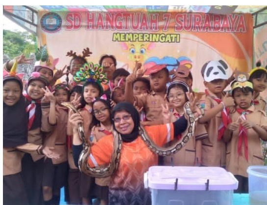
Gambar 3. Kegiatan Rekreatif & Edukatif

Ketiga edukatif, yaitu sekolah menjadi tempat utama dalam mengembangkan ilmu pengetahuan, karakter, dan keterampilan peserta didik tidak hanya fokus pada akademik saja melainkan pembentukan kepribadian dengan pendekatan yang kontekstual dan bermakna melalui penanaman nilai moral, sosial, dan agama secara berkelanjutan. Kegiatan edukatif dikemas dengan beberapa kegiatan, sesuai yang disampaikan oleh kepala sekolah “edukatif biasanya bekerjasama dengan satpol PP untuk memberikan sosialisasi kepada siswa dalam menangani kasus bullying, membiasakan saling mengingatkan dan melapor jika terjadi adanya tindakan bullying, melatih kedisiplinan siswa jika melanggar akan diberikan panishmen yang edukatif. dan literasi” (W/KS/2/2/26). Hasil wawancara tersebut membuktikan kegiatan pendidikan tidak hanya terfokus pada akademik saja, melainkan juga pada bagaimana siswa membangun sikap, prinsip, dan tanggungjawab mereka di lingkungan sekolah. kegiatan edukatif juga dikemas melalui kegiatan religi seperti pembiasaan sholat duha, doa pagi, dan sholat duhur, serta didukung oleh kegiatan ekstrakurikuler.