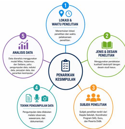
Gambar 1. Langkah-langkah Metode Penelitian

pengambilan data yang telah dirancang dan dapat dikembangkan sesuai fokus dan tujuan penelitian. Teknik analisis data menggunakan teknik milik (Matthew B. Miles et al., 2014) yang dilakukan melalui tahapan; pengumpulan data, pengkodean, penyajian data, dan verifikasi kesimpulan data yang diperoleh. Pendekatan ini memberikan kemudahan peneliti untuk menemukan keterkaitan antar kategori dan menafsirkannya secara deskriptif menggunakan kerangka konseptual dan konteks penelitian yang digunakan. Berikut ilustrasi langkah-langkah dalam menentukan metode penelitian;