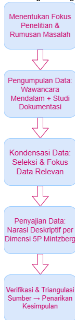
Gambar 1. Alur Langkah-langkah penelitian