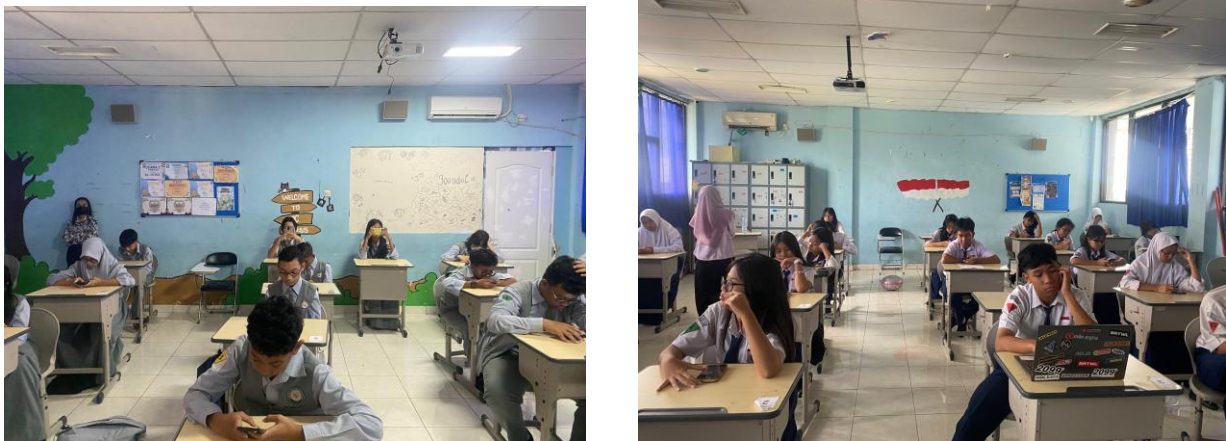
Gambar 3 & 4. Kegiatan Literasi Membaca

Bahan bacaan yang digunakan disesuaikan dengan mata pelajaran yang akan dipelajari pada hari tersebut, sehingga kegiatan membaca memiliki keterkaitan langsung dengan konteks pembelajaran. Setelah membaca, siswa tidak hanya berhenti pada aktivitas pasif, tetapi diwajibkan untuk menuliskan ringkasan atau menjawab pertanyaan melalui jurnal literasi berbasis web sekolah. Selain itu, pola literasi juga terintegrasi dalam kegiatan Proyek Penguatan Profil Pelajar Pancasila (P5), di mana siswa dari kelas 7 hingga kelas 9 secara bertahap dilibatkan dalam proyek berbasis riset mandiri yang menuntut aktivitas membaca, analisis informasi, dan penyajian karya.