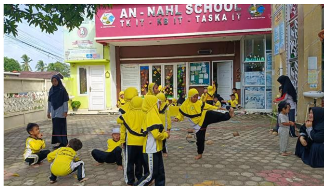
Gambar 2. Metode bermain sambil belajar

Metode bermain sambil belajar terlihat dominan pada kegiatan inti di sentra, di mana seluruh aktivitas dikemas dalam bentuk permainan yang bermakna. Anak diberi kebebasan bereksplorasi dalam lingkungan yang telah disiapkan guru secara cermat. Data observasi menunjukkan bahwa pendekatan ini berhasil membuat anak belajar tanpa merasa terbebani, sehingga aspek life skills seperti kreativitas, pemecahan masalah, dan komunikasi berkembang secara alami.