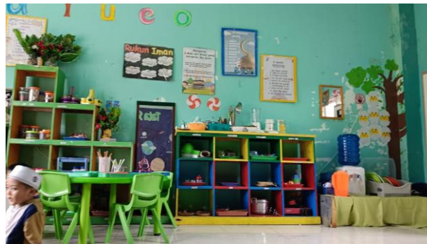
Gambar 1. Penataan Ruang Kelas

belajar, pengelolaan tenaga pendidik, dan pengaturan jadwal kegiatan harian. Dalam hal penataan lingkungan, sekolah menggunakan sistem sentra yang membagi ruang kelas menjadi beberapa area dengan fungsi berbeda. Pendekatan ini berangkat dari keyakinan bahwa lingkungan berperan sebagai guru bagi anak, sehingga setiap bagian ruangan ditata agar bermakna dan mengundang anak untuk aktif bereksplorasi. Semua bahan dan perlengkapan belajar diletakkan di tempat yang bisa dijangkau anak sendiri, disertai label bergambar sebagai penunjuk visual. Penataan seperti ini secara langsung melatih anak untuk bersikap mandiri dan bertanggung jawab terhadap barang-barang di sekitarnya. Di samping ruang kelas, area luar seperti taman, kebun, dan playground juga dimanfaatkan sebagai ruang belajar yang kontekstual, di mana anak dapat belajar merawat tanaman, bermain bersama, dan menyelesaikan perselisihan kecil secara mandiri.