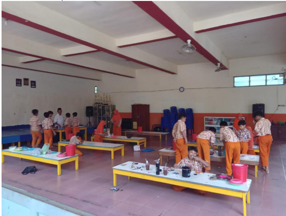
Gambar 4. Pembelajaran Inklusif di Luar Ruangan

persepsi orang tua yang belum sepenuhnya menerima konsep pendidikan inklusi. Kendala tersebut berdampak pada belum optimalnya konsistensi penerapan strategi pembelajaran inklusif (Akbarjono et al., 2022).