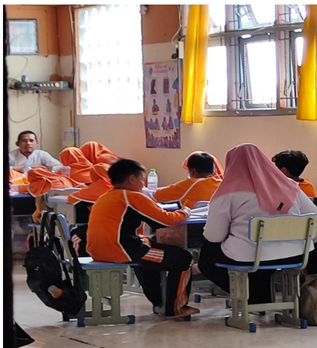
Gambar 3. Pendampingan Guru terhadap Peserta Didik Berkebutuhan Khusus dalam Proses Pembelajaran

Selain itu, guru telah menerapkan prinsip pembelajaran diferensiatif melalui pemberian tugas bertahap, penjelasan ulang secara individual, serta pemanfaatan kerja kelompok. Strategi ini berkontribusi pada meningkatnya keterlibatan ABK dalam proses pembelajaran dan interaksi sosial dengan teman sebaya. Hasil dokumentasi juga menunjukkan adanya penyesuaian perangkat pembelajaran sebagai respons sekolah terhadap kebutuhan peserta didik inklusif.