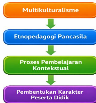
Gambar 2. Model Integrasi Multikulturalisme dan Etnopedagogi Pancasila

Model tersebut menunjukkan bahwa multikulturalisme menjadi dasar konseptual yang kemudian diimplementasikan melalui etnopedagogi Pancasila dalam proses pembelajaran, yang pada akhirnya bermuara pada pembentukan karakter peserta didik. Secara keseluruhan, hasil penelitian ini menegaskan bahwa integrasi antara multikulturalisme dan etnopedagogi Pancasila merupakan pendekatan yang efektif dalam membangun sistem pendidikan yang inklusif, kontekstual, dan berorientasi pada penguatan karakter.