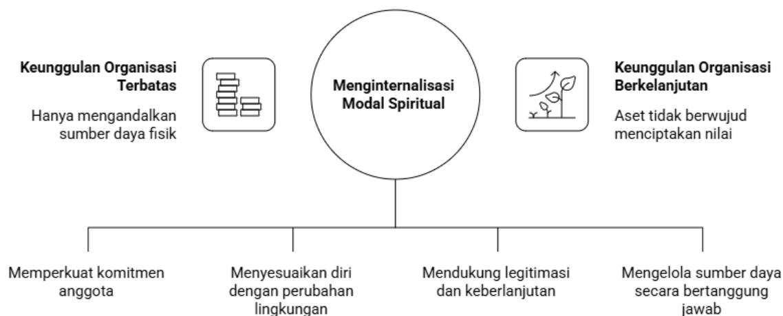
Gambar 2. Peran Modal Spiritual dalam Keunggulan Organisasi

Lebih lanjut, literatur terbaru menunjukkan bahwa modal spiritual memiliki hubungan yang signifikan dengan keberlanjutan organisasi. Nilai-nilai spiritual yang terinternalisasi dalam budaya organisasi mampu mendorong terbentuknya perilaku etis, kepemimpinan yang berorientasi pelayanan, serta pengelolaan sumber daya yang lebih bertanggung jawab. Kondisi tersebut berkontribusi terhadap peningkatan reputasi organisasi, kepercayaan pemangku kepentingan, dan ketahanan institusi dalam menghadapi tantangan ekonomi maupun sosial. Dengan demikian, modal spiritual tidak dapat dipandang sebagai elemen normatif semata, melainkan sebagai sumber daya strategis yang memiliki implikasi nyata terhadap kinerja dan keberlanjutan lembaga Pendidikan (Hijazi & Al-Ajlouni, 2026; Hussain & Afzal, 2023).