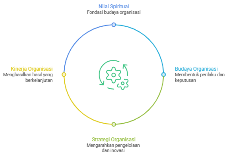
Gambar 3. Model Konseptual Integrasi Modal Spiritual dan Keberlanjutan Ekonomi

Berdasarkan sintesis literatur, integrasi modal spiritual dan keberlanjutan ekonomi dapat dijelaskan melalui alur hubungan nilai → budaya → strategi → kinerja . Alur ini menunjukkan bahwa nilai spiritual merupakan sumber utama yang membentuk budaya organisasi, budaya memengaruhi arah strategi, dan strategi yang dijalankan secara konsisten menghasilkan kinerja organisasi yang berkelanjutan. Temuan ini memperlihatkan bahwa dimensi spiritual dan ekonomi memiliki hubungan yang bersifat komplementer, bukan dikotomis.