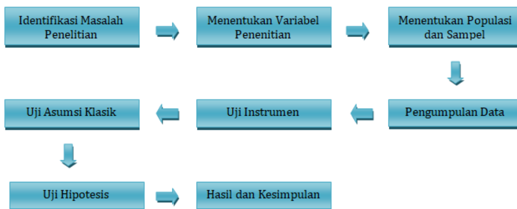
Gambar 1. Langkah-Langkah Metode Penelitian

Data diuji menggunakan instrumen (uji validitas dan uji reliabilitas), dilanjutkan dengan melakukan uji asumsi klasik (uji normalitas, uji multikolinearitas, dan uji heteroskedastisitas) dan uji hipotesis (persamaan regresi linear berganda, uji t, uji F, dan uji koefisien determinasi ( R^2 )).