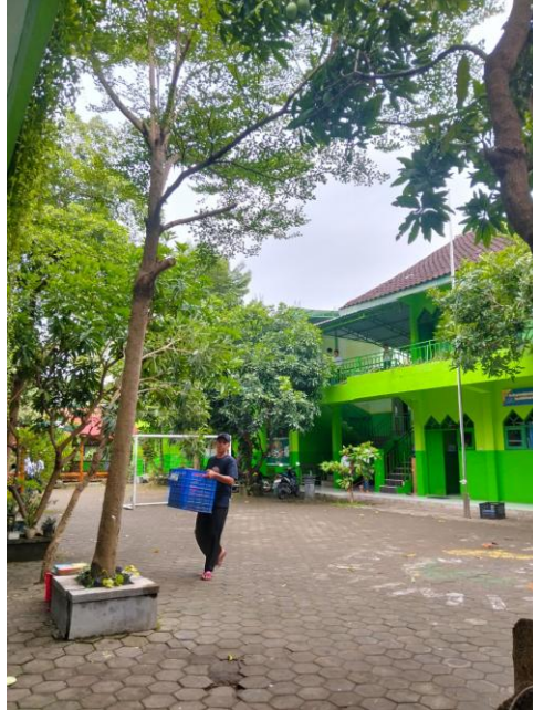
Gambar 2. Tempat Penelitian

Hasil penelitian ini menyajikan temuan terkait implementasi mentoring dalam pembelajaran Pendidikan Agama Islam (PAI) pada siswa kelas VIII di SMPIT Mutiara Insan Sukoharjo tahun ajaran 2025/2026.