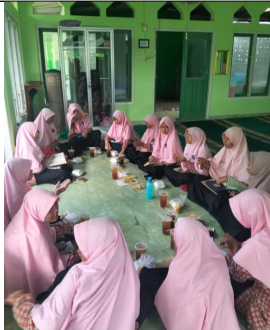
Gambar 3. Kegiatan Mentoring

Berdasarkan hasil wawancara, siswa merasa lebih nyaman dan tidak canggung dalam menyampaikan pertanyaan maupun permasalahan yang mereka hadapi. Kedekatan ini memungkinkan terjadinya proses pembelajaran yang lebih personal dan mendalam, sehingga pemahaman siswa terhadap materi menjadi lebih optimal.