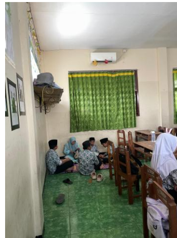
Gambar 3 Kegiatan Setoran Hafalan