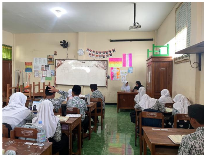
Gambar 4 Kegiatan Setoran Hafalan

Berdasarkan dokumentasi pada gambar 2, 3, dan 4, pelaksanaan program tahfidz dilakukan secara rutin dengan dibimbing oleh guru tahfidz.