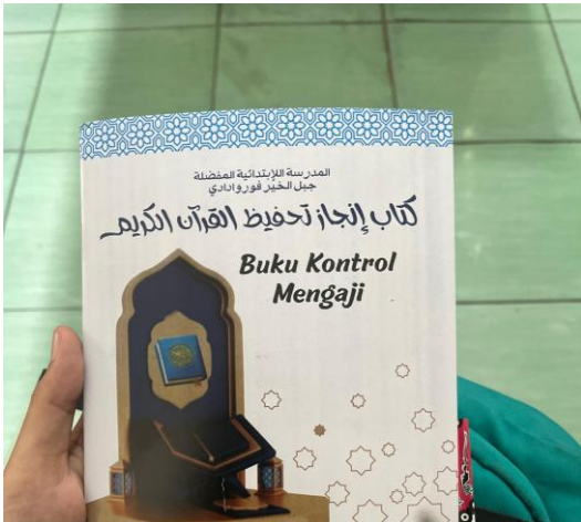
Gambar 2 Buku Kontrol Mengaji