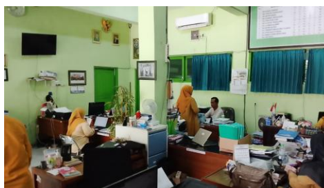
Gambar 2. Ruang Tata Usaha MTsN 4 Sidoarjo

Secara keseluruhan, hasil penelitian menunjukkan bahwa administrasi persuratan dan kearsipan di MTsN 4 Sidoarjo telah mengarah pada pemenuhan prinsip-prinsip Standar Nasional Pendidikan, khususnya pada aspek pengelolaan dokumen dan pemanfaatan teknologi informasi. Akan tetapi, masih diperlukan penguatan pada aspek standardisasi prosedur, integrasi sistem administrasi, serta pengembangan instrumen evaluasi mutu agar sistem administrasi yang diterapkan tidak hanya efektif secara operasional, tetapi juga memenuhi prinsip penjaminan mutu yang berkelanjutan.