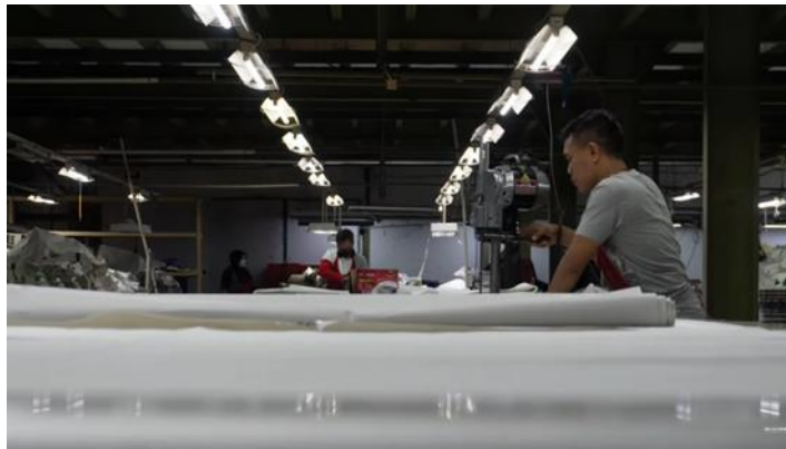
Gambar.4 Proses Produksi

Pengambilan gambar dilakukan dari sudut rendah sejajar dengan permukaan meja potong yang dipenuhi lembaran kain putih sehingga aktivitas kerja di latar belakang tampak berlapis dan memberikan kedalaman visual yang kuat. Adegan ini menjadi salah satu momen paling substantif dalam company profile , karena ia berbicara langsung tentang inti dari apa yang perusahaan ini dilakukan dan siapa orang-orang yang menjalakkannya.