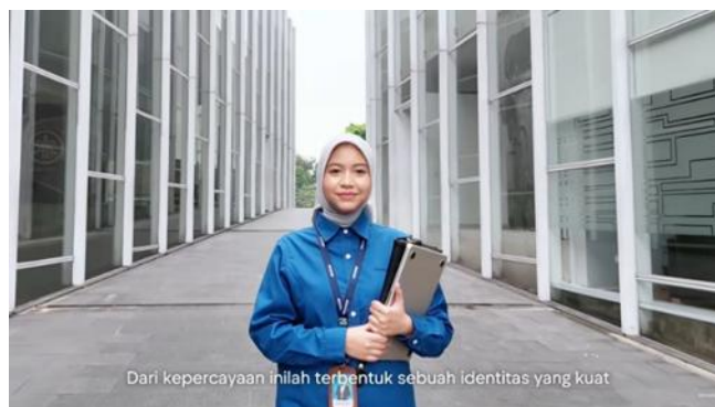
Gambar.3 Berjalan ke Arah Depan

Penerapan teknik tracking shot juga digunakan dalam adegan ketika pemeran utama berjalan lurus ke depan, dengan posisi kamera ditempatkan menghadap langsung ke arah subjek. Berbeda dari sudut pengambilan sebelumnya, adegan ini dimulai dari jarak yang sangat dekat wajah dan ekspresi pemeran utama terlihat jelas dan mendominasi frame lalu kamera secara bertahap mundur menjauhi subjek sehingga sosok pemeran utama tampak semakin kecil di tengah luasnya lingkungan perusahaan yang mengitarinya. Adegan ini tidak hanya memperlihatkan seorang individu yang melangkah, tetapi juga menegaskan bahwa di balik setiap langkah tersebut terdapat ekosistem kerja yang solid, terstruktur, dan siap mendukung setiap proses yang berjalan di dalamnya. Hal ini sejalan dengan pendapat Mercado (2020) yang menyatakan bahwa perubahan jarak kamera terhadap subjek secara bertahap dapat digunakan sebagai alat naratif untuk menyampaikan makna yang lebih dalam, termasuk menggambarkan relasi antara individu dengan system atau institusi yang lebih besar di sekitarnya.