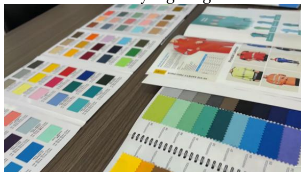
Gambar.7 Color Chart dan Katalog

Teknik tracking shot juga digunakan dalam adegan yang memperlihatkan berbagai sampel material dan referensi warna yang tersebar di atas meja kerja. Kamera bergerak perlahan menyusuri permukaan meja, merekam deretan color chart dan katalog produk yang tertata dengan beragam pilihan warna dari nuansa cerah hingga warna-warna gelap yang kaya seolah mengajak penonton untuk ikut menelusuri kekayaan pilihan yang ditawarkan perusahaan kepada setiap kliennya. Hal ini sejalan dengan temuan Shafa dan Pranata (2025) yang menyatakan bahwa pergerakan kamera seperti tracking shot dalam produksi video sinematik mampu menciptakan konten visual yang menarik dan komunikatif, sehingga detail produk maupun kapabilitas perusahaan dapat tersampaikan secara efektif kepada audiens. Melalui pendekatan tracking shot dalam adegan shot ini, Boogie Apparel memperlihatkan sisi lain dari kapabilitasnya yang tidak selalu tampak di permukaan kemampuan merancang dan menyesuaikan produk sesuai spesifikasi klien dengan ragam pilihan material dan warna yang sangat variatif.