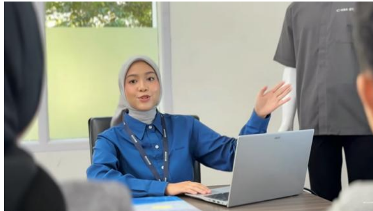
Gambar.6 Presentasi dengan Klien

yang duduk berhadapan. Hal ini sejalan dengan Pranata, Rahayu dan Pebrianti (2025), yang menyatakan bahwa penggunaan teknik pengambilan gambar yang tepat dalam video profil merupakan elemen penting dalam video profil merupakan elemen penting dalam menyampaikan pesan dan menciptakan daya tarik visual, di mana pemilihan sudut dan pergerakan kamera yang sesuai dengan konteks adegan mampu menghadirkan konten yang informatif, menarik, dan komunikatif bagi audiens. Gerakan kamera yang mengalir dari satu sisi ke sisi lain ini secara bertahap memperkenalkan suasana ruang pertemuan, dokumen yang tersebar di atas meja, gestur tangan yang menyertai penjelasan, hingga ekspresi serius namun terbuka dari kedua belah pihak yang tengah terlibat dalam diskusi yang produktif.