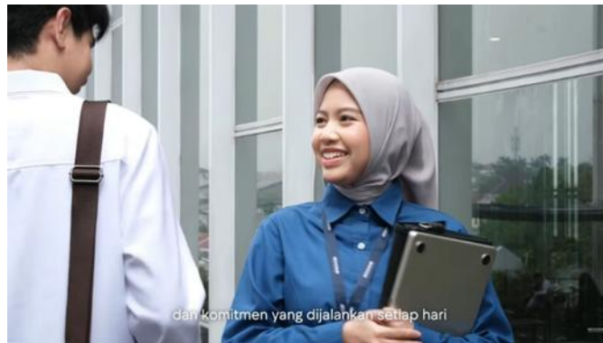
Gambar.2 PU Berpapasan dengan Rekan Kerja

dan kekompakan tim berhasil dikomunikasikan tanpa perlu narasi tambahan.