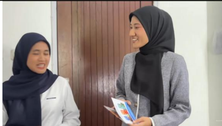
Gambar.9 Sales dan Klien Berjalan