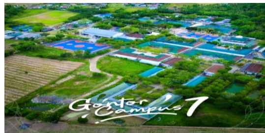
Gambar: Lokasi Penelitian