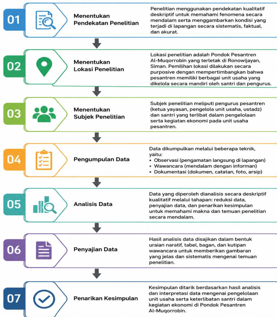
Gambar 1. Langkah-Langkah Metode Penelitian

Dengan demikian, melalui pendekatan kualitatif deskriptif ini diharapkan penelitian mampu memberikan gambaran yang komprehensif mengenai pengelolaan unit usaha di Pondok Pesantren Al-Muqorrobin serta dinamika keterlibatan santri dalam kegiatan ekonomi yang berlangsung.