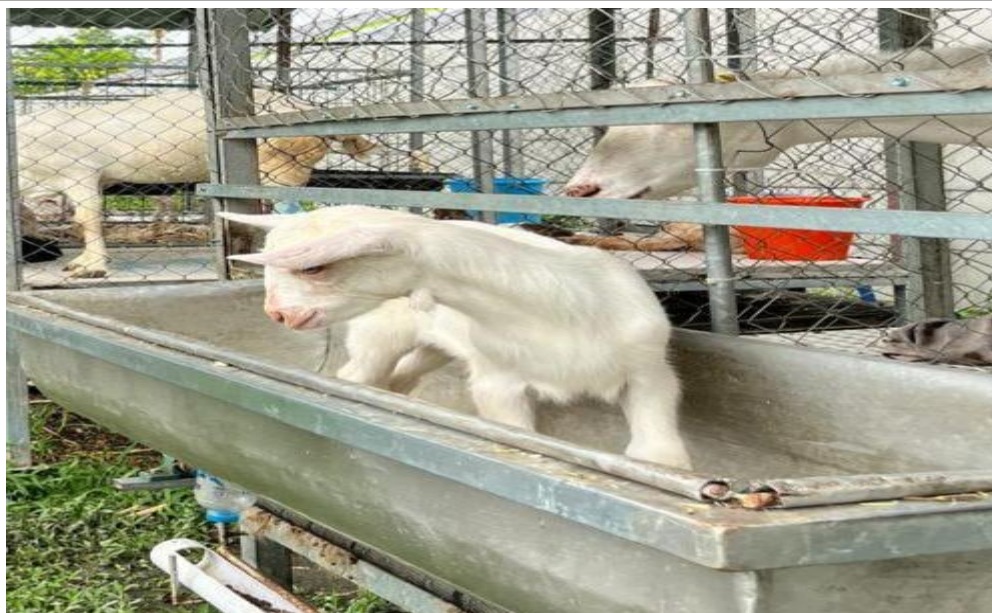
Gambar 1. Jenis usaha yang menunjang finansial sekolah

Gambar 1 menunjukkan salah satu bentuk usaha yang menunjang finansial di smk al Faruqi kubang raya riau yaitu usaha peternakan kambing yang menghasilkan kualitas susu murni dan premium dengan kemasan yang higienis sehingga menarik para konsumen untuk membeli dan mencobanya. Dengan adanya usaha peternakan yang menghasilkan susu tersebut maka menjadi salah satu usaha yang sangat menunjang kemandirian finansial di smk al Faruqi.