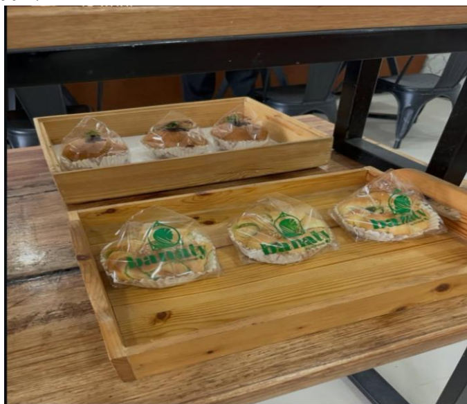
Gambar 1. Jenis usaha yang di terapkan

Gambar 1 menunjukkan salah satu bentuk nyata kegiatan usaha yang dijalankan oleh sekolah, yaitu produk roti dengan brand Banaty. Produk ini merupakan hasil dari kegiatan kewirausahaan di bidang bakery yang dikelola oleh sekolah dengan melibatkan siswa secara langsung dalam proses produksi hingga penjualan. Roti Banaty diproduksi dengan berbagai varian rasa dan dikemas secara menarik sehingga memiliki nilai jual yang kompetitif. Selain sebagai media pembelajaran praktik bagi siswa dalam bidang tata boga dan bisnis, produk ini juga menjadi salah satu sumber pendapatan sekolah. Penjualan roti Banaty tidak hanya dilakukan di lingkungan sekolah, tetapi juga berpotensi dipasarkan ke masyarakat sekitar. Dengan demikian, keberadaan produk ini tidak hanya mendukung pengembangan keterampilan siswa, tetapi juga berperan dalam menunjang finansial sekolah secara berkelanjutan.