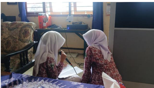
Gambar 2. Kegiatan membaca Al-Qur'an