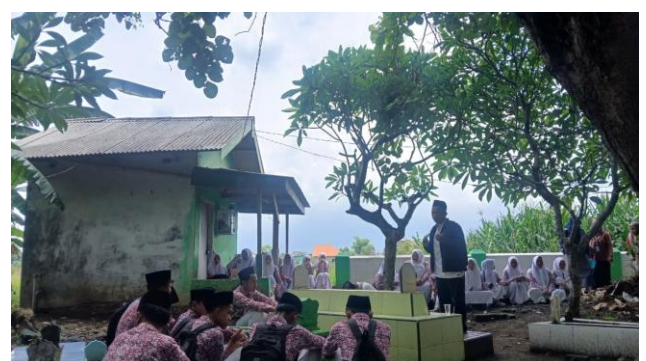
Gambar 3. Kegiatan ziarah kubur

Berdasarkan hasil wawancara dengan guru pendidikan agama islam di peroleh