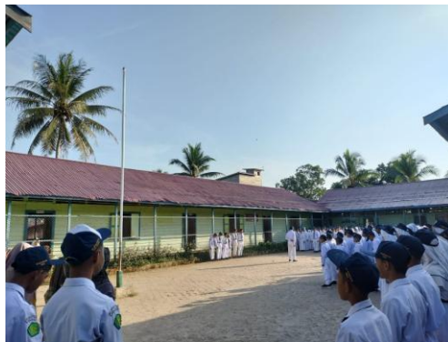
Gambar. 3 MTs PPKP Ribathul Khail Tenggarong