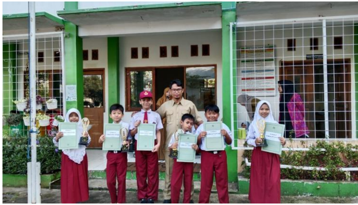
Gambar 3. Dampak Partisipasi Masyarakat terhadap Mutu Pendidikan melalui Prestasi Peserta Didik

Gambar di atas menunjukkan peserta didik SD Plus Ar-Rahmat Cileunyi yang berhasil meraih prestasi dalam sebuah perlombaan yang ditandai dengan perolehan piala dan piagam penghargaan. Prestasi tersebut mencerminkan adanya peningkatan mutu pendidikan yang didukung oleh kerja sama antara sekolah dan masyarakat. Keterlibatan orang tua dalam mendampingi proses belajar anak, memberikan motivasi, serta mendukung berbagai program sekolah turut berkontribusi terhadap perkembangan kemampuan peserta didik. Selain itu, dukungan masyarakat terhadap kegiatan pendidikan membantu menciptakan lingkungan belajar yang kondusif sehingga peserta didik dapat mengembangkan potensi akademik maupun nonakademiknya secara optimal. Dengan demikian, prestasi yang diraih peserta didik pada gambar tersebut menunjukkan bahwa partisipasi masyarakat memberikan dampak positif terhadap peningkatan mutu pendidikan di SD Plus Ar-Rahmat Cileunyi.