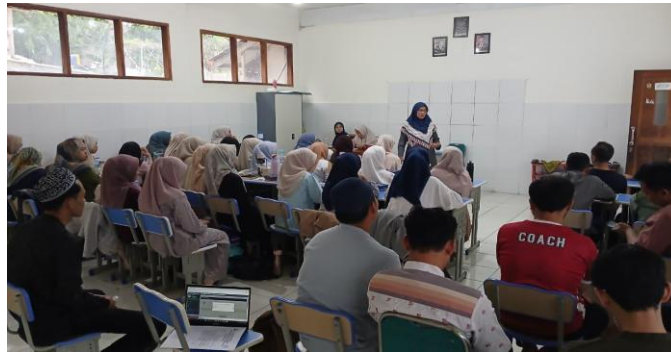
Gambar 2. Rapat Wali Murid di Awal Semester

Partisipasi masyarakat tersebut memberikan dampak positif terhadap kegiatan pendidikan di sekolah. Keterlibatan masyarakat membantu menciptakan hubungan kerja sama yang baik antara sekolah dan masyarakat sehingga kegiatan pendidikan dapat berjalan lebih efektif dan kondusif.