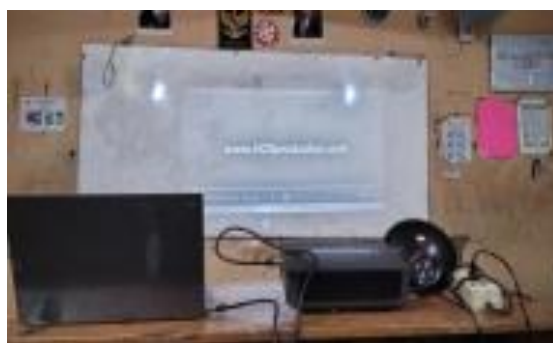
Gambar 2 Proses Pembelajaran

Pelaksanaan diawali dengan persiapan pembelajaran yang mencakup penyusunan dan penyesuaian perangkat ajar, pemilihan materi Akidah Akhlak, serta penyiapan media audio visual sebagai sarana pendukung pembelajaran. Selanjutnya, proses pembelajaran dilaksanakan dengan memanfaatkan media audio visual berupa video pembelajaran yang relevan dengan materi yang diajarkan.