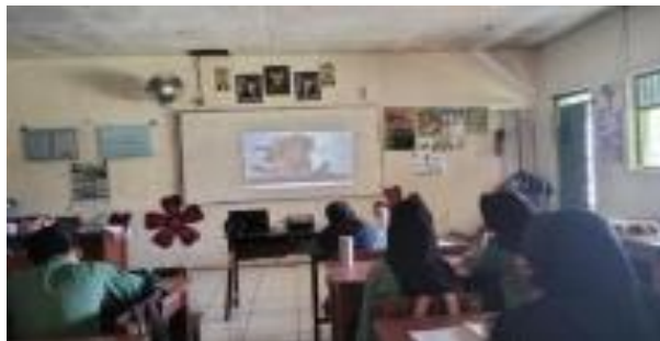
Gambar 3 Respon Siswa

Dengan melakukan analisis terhadap data kuesioner melalui pendekatan analisis regresi linear sederhana, diperoleh temuan sebagai berikut: