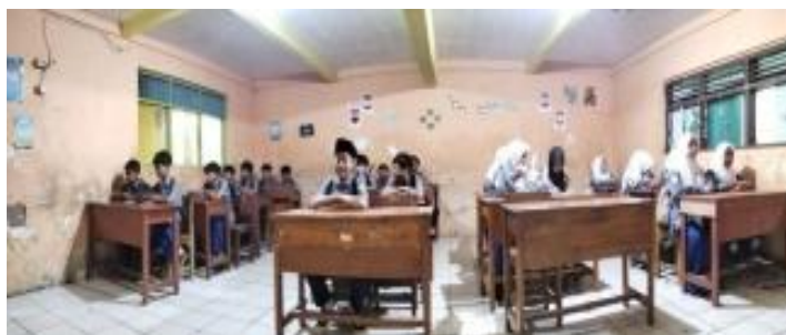
Gambar 1 Persiapan Pembelajaran

Kegiatan praktik profesi dilaksanakan di MTsS Al Istiqomah pada mata pelajaran Akidah Akhlak kelas VII selama periode 19 Februari hingga 6 Maret 2026. Pelaksanaan kegiatan disesuaikan dengan jadwal pembelajaran yang berlaku di sekolah.