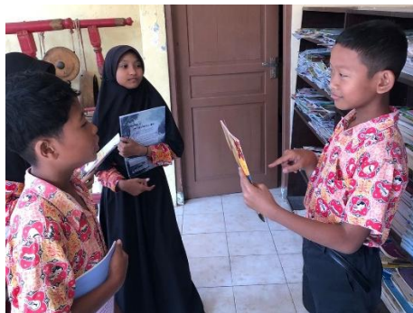
Gambar 2: Kegiatan berbagi cerita ( story sharing ) setelah kegiatan literasi

pembiasaan membaca selama 15 menit sebelum pembelajaran dimulai, penyediaan pojok baca di setiap kelas, penulisan jurnal harian oleh peserta didik, kunjungan perpustakaan yang dijadwalkan secara rutin setiap minggu, serta kegiatan berbagi cerita ( story sharing ) di dalam kelas. Berdasarkan hasil observasi dan wawancara dengan kepala sekolah, guru, dan peserta didik, seluruh kegiatan tersebut telah terlaksana secara konsisten selama dua semester terakhir dengan tingkat partisipasi siswa yang cukup tinggi.