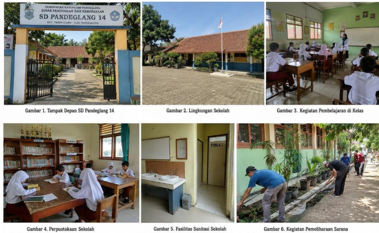
Dokumentasi Kondisi Sarana dan Prasarana di SD Pandeglang 14