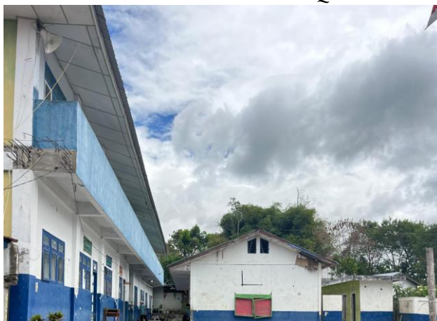
Gambar 2 MTsS Ulumul Qur'an

Madrasah juga didukung oleh fasilitas keagamaan seperti mushala, mushaf Al-Qur'an, serta ruang pembelajaran yang mendukung kegiatan literasi Al-Qur'an. Selain itu, sebagian besar guru memiliki latar belakang pendidikan pesantren dan berperan aktif dalam pembinaan keagamaan siswa. Dalam konteks ini, kepala madrasah memiliki peran strategis dalam mengarahkan kebijakan dan budaya literasi Al-Qur'an sehingga lokasi ini relevan untuk mengkaji peran kepemimpinan dalam pengembangan budaya literasi Al-Qur'an.