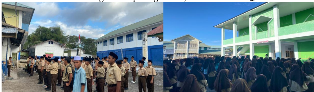
Gambar 3 Kegiatan Sapa Pagi Siswa/i MTsS Ulumul Qur'an

Pelaksanaan kegiatan diawali dengan pembentukan barisan siswa sesuai kelas masing-masing dengan pemisahan antara santri putra dan putri. Guru piket bertugas mengawasi jalannya kegiatan serta memastikan seluruh siswa mengikuti kegiatan dengan tertib.