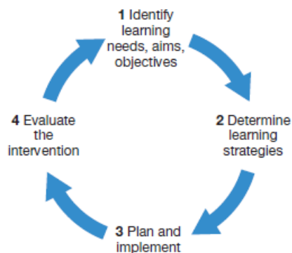
Gambar 1 Planning and Development Cycle

Najmatun Nahdah dalam penelitiannya menemukan proses pengembangan SDM terdiri dari perencanaan, pelaksanaan dan evaluasi dengan menggunakan strategi pengkaderan serta pengembangan kompetensi profesional dan karir untuk memenuhi standar pesantren. SDM unggul memiliki perencanaan pengembangan, analisis kebutuhan, dan meningkatnya daya saing lembaga. Bambang melalui sebuah penelitian mengemukakan bahwa ada pengaruh yang signifikan dari pengembangan sumber daya manusia terhadap kualitas pelayanan guru di sekolah.