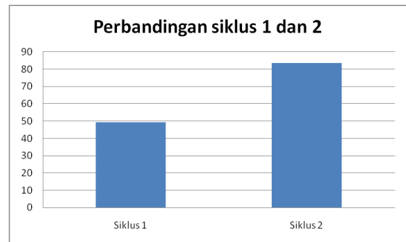
Gambar 3 Perkembangan Kemampuan guru Menyusun Perlengkapan mengajar (Perbandingan Siklus I dan Siklus II)

Berdasarkan tabel diatas, dapat disimpulkan bahwa adanya kemampuan guru dalam Membuat Perlengkapan mengajar di SMP 4 Pasaman. Untuk lebih mudah dalam memahami peningkatan kemampuan guru dalam Membuat Perlengkapan mengajar, dapat dilihat pada gambar berikut ini.