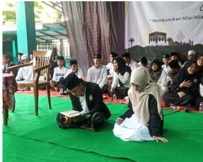
Gambar 2. Kegiatan istighosah dan sholawat di MA NU Sidoarjo

Pembiasaan ini merupakan bagian dari proses pemahaman secara mendalam akhlak Aswaja yang menekankan penguatan moral berbasis Aswaja. Nilai-nilai tersebut berfungsi bukan hanya sebagai ajaran keagamaan, tetapi juga sebagai aturan moral dalam interaksi sehari-hari. Dengan demikian sekolah berhasil menjadikan nilai Aswaja sebagai dasar pembentukan karakter ( Syahroni & Rofiq, 2025 ).