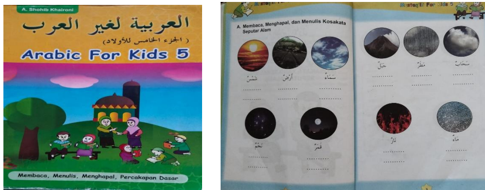
Gambar 2. Bahan ajar metode pembelajaran mustaqili

Hasil penelitian ini semakin memperkuat temuan dalam literatur bahwa pembelajaran mufradat yang kontekstual dan inovatif cenderung memberikan hasil belajar yang lebih baik dibandingkan pendekatan tradisional yang hanya berfokus pada hafalan mekanis tanpa makna kontekstual yang kuat. Hal ini sesuai dengan kajian yang menyoroti pentingnya konteks dalam penguasaan kosakata bahasa kedua (Nurhidayah et al., 2025).