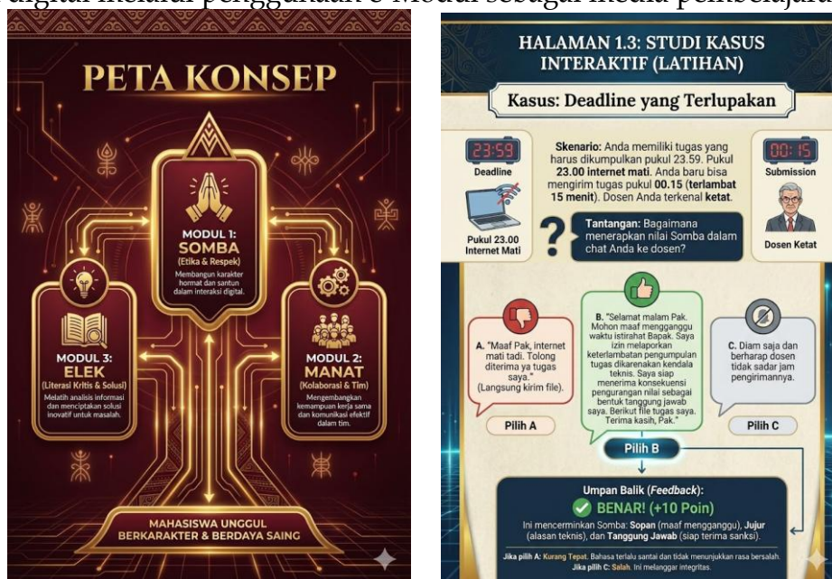
Gambar 2. Tampilan beberapa bagian dari e-Modul

Struktur e-Modul yang dirancang dalam penelitian ini terdiri atas empat topik utama yang saling berkaitan. Topik pertama membahas konsep Dalihan Na Tolu dan kepemimpinan , yang menjelaskan nilai-nilai dasar dalam filosofi Dalihan Na Tolu serta relevansinya dalam membangun kepemimpinan dan etika sosial. Topik kedua mengkaji tanggung jawab dalam konteks akademik , yang menekankan pentingnya sikap tanggung jawab mahasiswa dalam proses pembelajaran, baik secara individu maupun dalam kerja sama kelompok. Topik ketiga membahas literasi kritis dan analisis argumen , yang bertujuan untuk melatih kemampuan mahasiswa dalam menganalisis informasi, mengevaluasi argumen, serta mengambil keputusan secara rasional dan reflektif. Selanjutnya, topik keempat mengkaji integrasi teknologi dan kearifan lokal , yang menjelaskan bagaimana nilai-nilai Dalihan Na Tolu dapat diintegrasikan dalam pembelajaran digital melalui penggunaan e-Modul sebagai media pembelajaran inovatif.