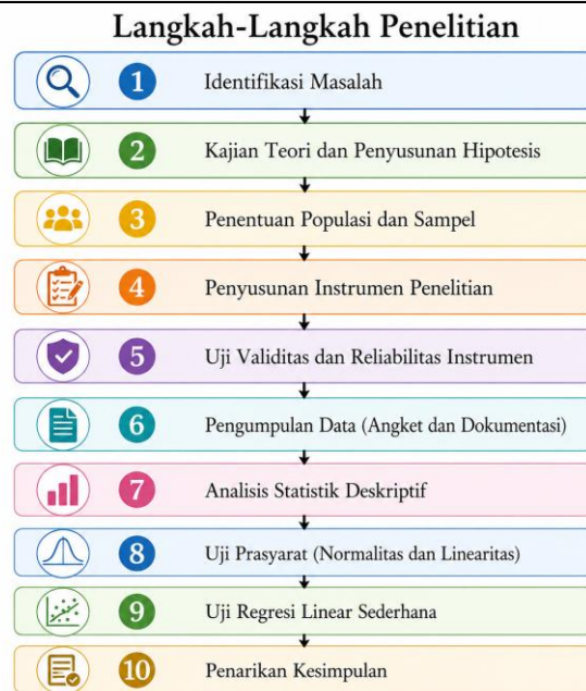
Gambar 1. Langkah-Langkah Penelitian