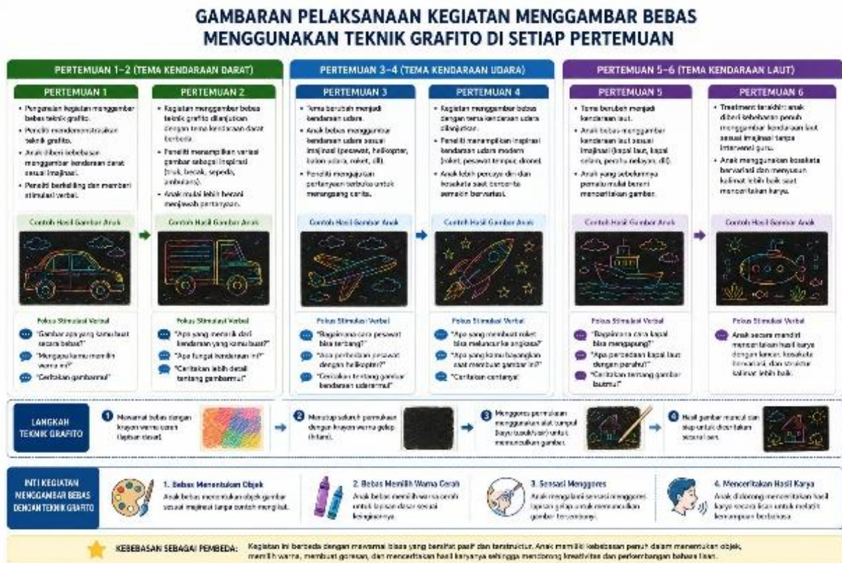
Gambar 1. Gambaran Tahapan Pelaksanaan Kegiatan Menggambar Bebas Menggunakan Teknik Grafito