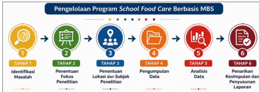
Gambar 2. Tahap Penelitian