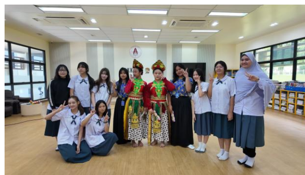
Gambar 4. Kegiatan Pertukaran Budaya (Thailand)

Pelaksanaan program memberikan pengalaman belajar yang berbeda dibandingkan proses pembelajaran di dalam kelas. Melalui interaksi langsung dengan sistem pendidikan dan budaya di negara mitra, peserta didik tidak hanya memperoleh pengetahuan akademik, tetapi juga mengembangkan kemampuan berkomunikasi dalam bahasa Inggris, beradaptasi dengan lingkungan multikultural, bekerja sama dalam tim lintas budaya, serta meningkatkan kemampuan berpikir kritis dan pemecahan masalah (Adar BakhshBaloch, 2017). Selain itu, pengalaman yang diperoleh selama mengikuti program dibagikan kembali kepada warga sekolah melalui kegiatan diseminasi dan berbagi pengalaman sehingga memberikan pengaruh terhadap penguatan budaya akademik yang berorientasi internasional.