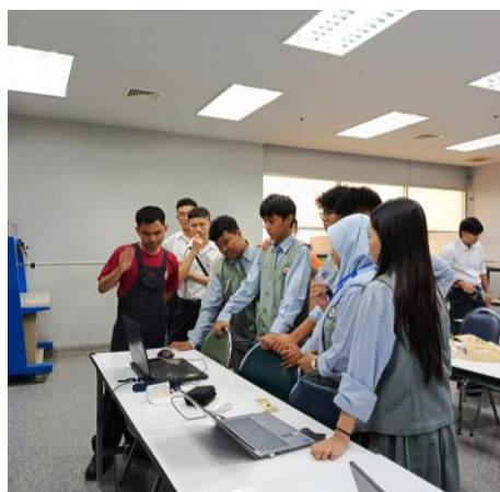
Gambar 3. Kegiatan Robotic di KMUTNB Thailand

Selama pelaksanaan program, guru pendamping berperan mengawasi, membimbing, serta memfasilitasi seluruh aktivitas peserta didik. Guru juga menjadi penghubung antara peserta didik dengan pihak sekolah maupun institusi mitra apabila terdapat kendala selama kegiatan berlangsung (Keislaman, 2018). Di sisi lain, BPSL terus melakukan koordinasi dengan sekolah mitra untuk memastikan seluruh agenda berjalan sesuai dengan rencana yang telah disusun. Koordinasi yang berkelanjutan tersebut memungkinkan setiap permasalahan dapat segera ditindaklanjuti sehingga tidak menghambat jalannya program.