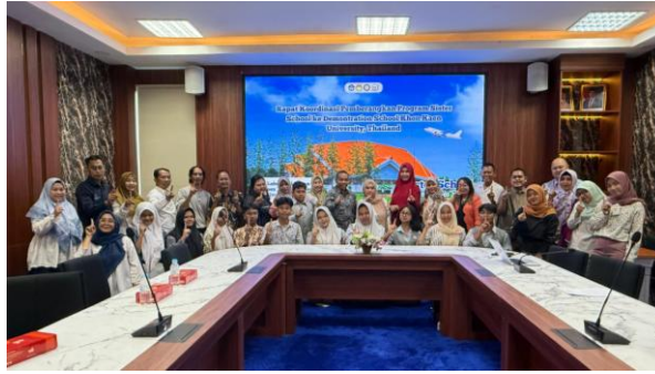
Gambar 2. Rapat Koordinasi

Koordinasi antarpihak dilaksanakan secara berkelanjutan melalui rapat koordinasi, pertemuan teknis, dan media komunikasi daring sehingga setiap informasi terkait pelaksanaan program dapat tersampaikan dengan cepat. Mekanisme koordinasi memungkinkan setiap pihak menjalankan tugas sesuai kewenangannya serta mempermudah penyelesaian berbagai kendala yang muncul selama pelaksanaan program (Aswaruddin1, 2024).